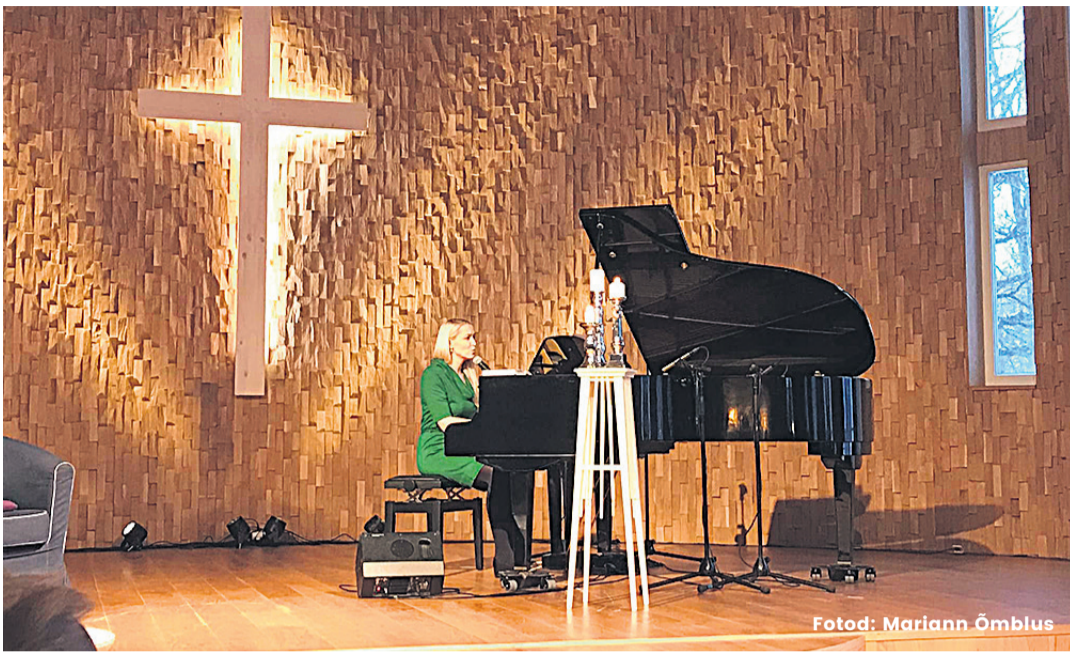
Kaare kooli jõulunädal algas neljandal adventil südamliku hommikukontserdiga Viljandi baptisti koguduse kirikus.

Viimane koolipäev oli kõige oodatum päev. Sõime kogu kooliperega ühiselt pika laua taga jõululõunat ning õhtul koguneme aulasse, kus leidis aset kontsertetendus «Nõiutud metsa saladus». Etendusel esinesid kõik õpilased ning mõned õpetajadki. Loomulikult tuli meile külla ka kaugel Lapimaalt jõuluvana Pelle, kellel oli tee peal