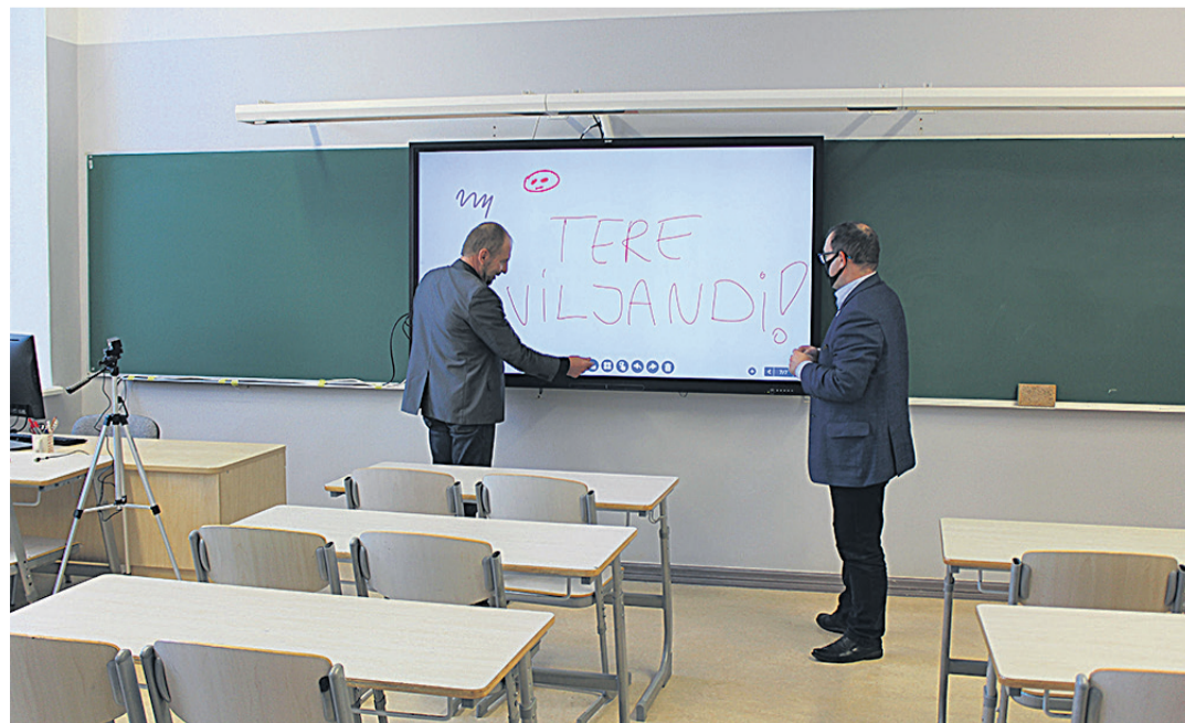
Interaktiivsel tahvliil on võimalik kirjutada eri viisil ja värvidega ning kirjutatut ka salvestada.

Interaktiivsed tahvlid on tootnud SMART Technologies ULC. Ühe interaktiivse tahvli hind on 3000 eurot koos käibemaksuga ning selle jaoks tuli raha Viljandi linna eelarvest.