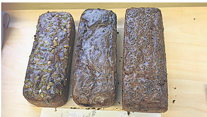
Jõulunädalal küpsetasid Kaare kooli lapsed traditsioonilist juuretise tehtud leiba.

Sellised need meie möödunud jõulud Kaare Koolis olidki. Nagu ütles üks õpilane: «Väga mõnus jõulu vibe!». Tuleb nõustuda, oli tõesti.