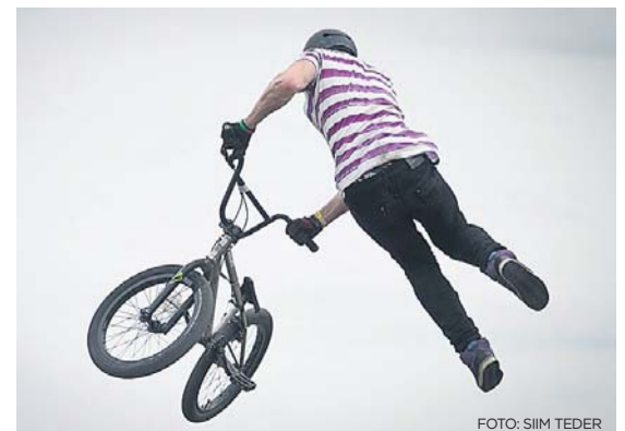
Eelmise aasta «Viljandi BASH»

Lisainfo tulevaste festivalide kohta asub koduleheküljel www.bash.ee.