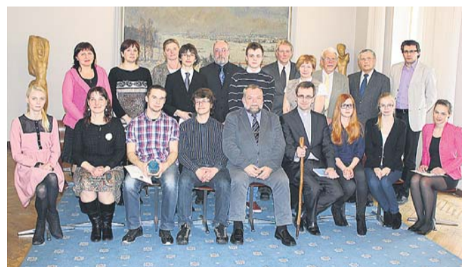
2013. aasta August Maramaa nimelise matemaatikaülesannete lahendamise võistluse parimad

tatud tasuma kohustusliku kogumispension makset ning kes kasvatab Eestis kuni kolmeaastast last. Õigus täiendavale sissemaksele tekib alates lapse sünnist ja seda saab taotlelda koos peretoetuse või vanemahüvitisega. Riik maksab teise sambasse 4 protsenti Eesti keskmisest sotsiaalmaksuga maksustavast ühe kalendrikuu tulust. Seega on õigus igas kuus 30.99 euro väärtuses omandada pensionifondi osakuid. Sissemakseid tehakse igas kuus eelmise kalendrikuu eest ning avaldus sissemaksete taotlemise kohta tuleb esitada sotsiaalkindlustusametile. Täiendavaid sissemakseid tehakse korraga ühe vanema eest. Kui sama lapse suhtes on õigus taotlelda täiendavate sissemaksete tegemist mitmel õigustatud isikul, siis lepitakse kokku, kes seda õigust kasutab. Kokkulepet väljendab kirjalik nõusolek.