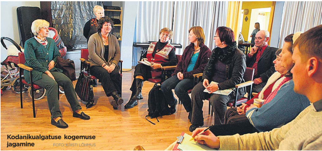
Kodanikualgatuses kogemuse jagamine