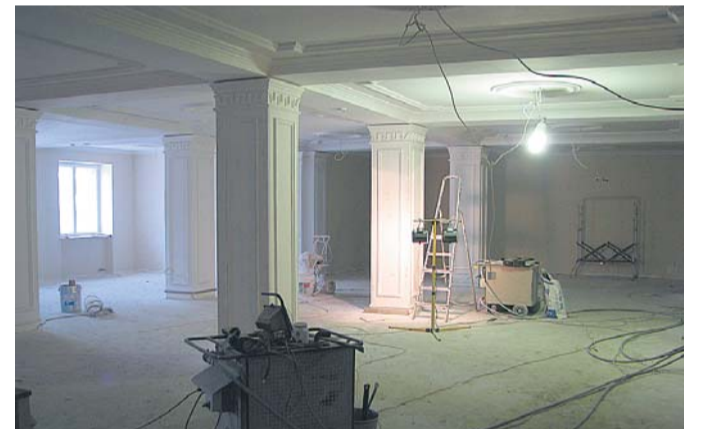
Sakala keskus enne roosaks muutumist

Lisainfo tel 433 3992 või info@sakalakeskus.ee.