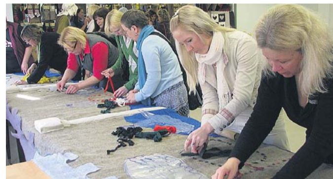
Bonifatiuse gildi teine sünnipäev

18. aprillil kell 12 alustab mit- tetulundusühing Bonifatiuse Gild oma esimese juubeli tä- histamist. Väike-Turu tänav 8 hoones asuv gild saab viieaas- taseks. Selle sündmuse puhul kor- raldatakse gildi majas kogu päev mitmeid üritusi. Avatud on töötoad ning väiksemate- le külalistele pakuvad rõõmu batuudid. Päev algab Viljan- di linna 730. aastapäevaks rõõmu- ja murepaela punu- misega, millest saab kogu su- ve vältel linnarahvas osa võt- ta. Punutakse 730-sentimeet- rine pael, mille sisse saab kirjutada Viljandiga seotud mured, rõõmud ja ettepane- kud. Õhtu kulmineerub tordipeo- ga, kirsiks tordil on «Põldsepp ja pojad». Üritus on kõigile huvilistele ja külalistele tasu- ta. Gildi majas on terve päev kõigile toodetele ja samal päe- val tellitud ning tasuta tee- nustele 5-protsendiline alla- hindlus. Bonifatiuse gild ise võtab pidupäeva puhul hea- meelega vastu kingitusi ja an- netusi.