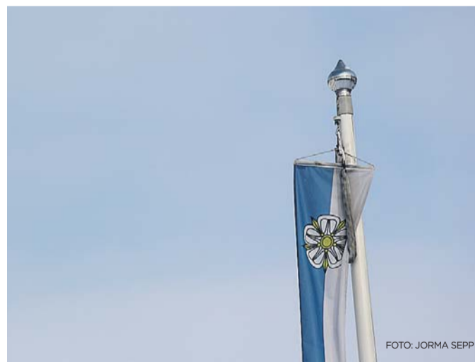
Viljandi lipu värvides viir, mis näitab, et külalised on teretulnud.

Vähem kui kolme nädala pärast leiab aset 84. Suurjooks ümber Viljandi järve. Mul on kahju, et tänavuse võistluse korralduslik pool on tekitanud palju arusaamatusi, kuid asjad on liikunud õiges suunas ning esimene registreerimisperiood on toonud stardinimekirja 1457 osalejat, neist 1317 jooksjat ning 140 kepikõndijat. Need numbrid näitavad, et traditsioon jätkub ning kevadpüha ajal võib näha tuhandeid liikumishuvilisi kõndimas-jooksmas ümber meie kauni järve. Mõned neist on siin juba 50. korda, mõned aga esimest või teist korda. Eesti kõige pikema traditsiooniga rahvaspordivõistlus jätkub väärikalt!