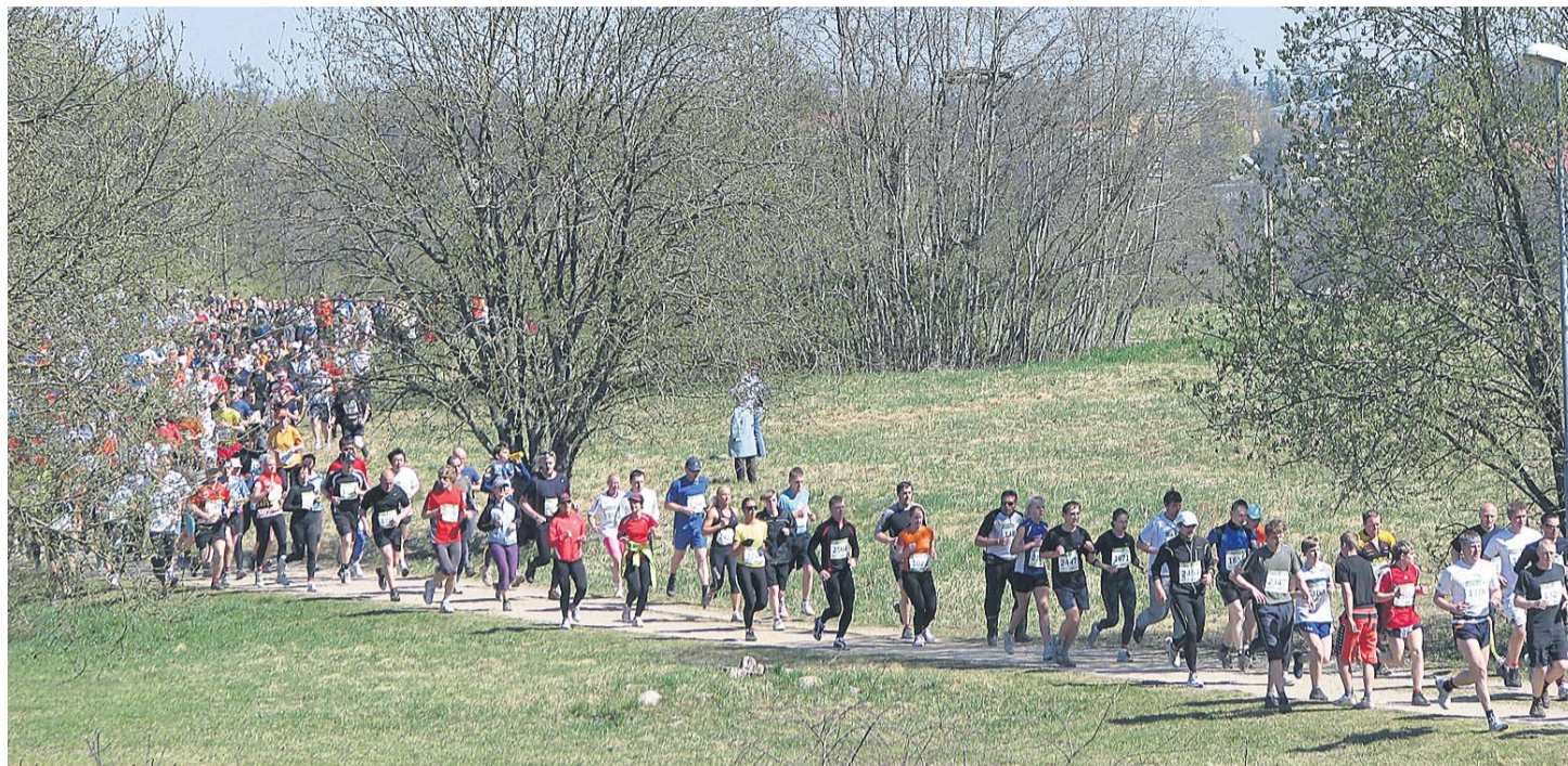
Mullune, 83. ümber Viljandi järve jooks, kus osales üle 3000 sportlase.